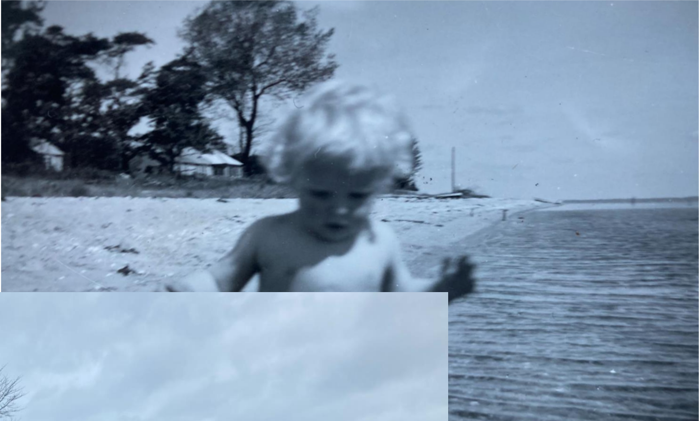
Sommeren ca. 1954