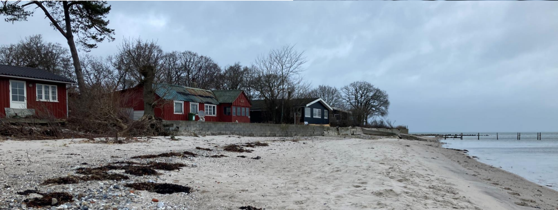
4. Februar 2024